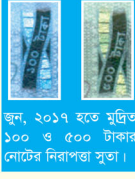
জুন, ২০১৭ হতে মুদ্রিত ১০০ ও ৫০০ টাকার নোটের নিরাপত্তা সূত্র।

০১। নিরাপত্তা সূত্রঃ ১০০, ৫০০ ও ১০০০ টাকা মূল্যমান নোটের নিরাপত্তা সূতায় বাংলাদেশ ব্যাংকের লোগো এবং নোটের মূল্যমান মুদ্রিত আছে যা নোট এদিক-ওদিক (Tilt) করলে দেখা যাবে। জুন, ২০১৭ হতে প্রচলিত ১০০ ও ৫০০ টাকা মূল্যমান নোটও এদিক-ওদিক করলে চলের বেনী সদৃশ নিরাপত্তা সূত্রের একটি অংশ (Band) লাল হতে সবুজ রংয়ে পরিবর্তন হবে এবং অপরটির সম্পূর্ণ অংশে বাংলায় লেখা নোটের মূল্যমান দেখা যাবে। সাধারণ আলোয় নোটের মূল্যমান আংশিক দেখা গেলেও টেবিল ল্যাম্প কিংবা টর্চ লাইটের নিচে নোট ধরলে পুরো Band জুড়ে মূল্যমান দেখা যাবে।